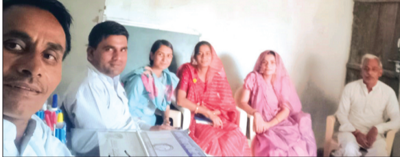
हरिभूमि न्यूज ▶▶ जावर

ग्राम भारती शिक्षा समिति जिला सीहोर द्वारा संचालित सरस्वती शिशु मंदिर दरखेड़ा में दिनांक 3 जुलाई को जिला प्रमुख का आगमन हुआ। आचार्य परिवार ने स्वागत