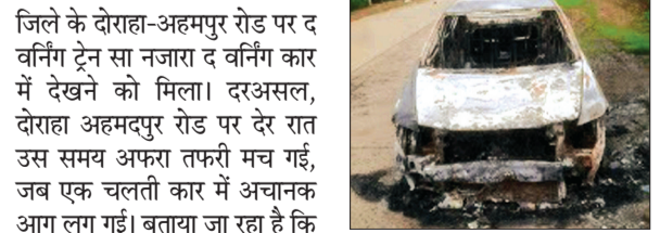
हरिभूमि न्यूज ▶▶ सीहोर

जिले के दोराहा-अहमपुर रोड पर द वर्निंग ट्रेन सा नजारा द वर्निंग कार में देखने को मिला। दरअसल, दोराहा अहमपुर रोड पर देर रात उस समय अफरा तफरी मच गई, जब एक चलती कार में अचानक आग लग गई। बताया जा रहा है कि कार में शॉर्ट सर्किट के कारण धुआं उठने लगा। चालक ने तत्परता दिखाते हुए वाहन को रोड के साइड पर रोका और समय रहते सभी सवारियों को सुरक्षित बाहर निकाल लिया। कुछ ही पलों में आग ने पूरी कार को अपनी चपेट में ले लिया। कार पूरी तरह जल चुकी थी। सूचना मिलते पर पुलिस मौके पर पहुंची और मामलों की जांच शुरू कर दी।