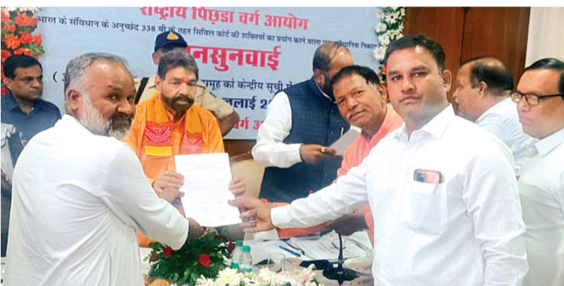
जिसमें फूलमाली समाज को केंद्र सरकार की सूची में शामिल हो जाएगा