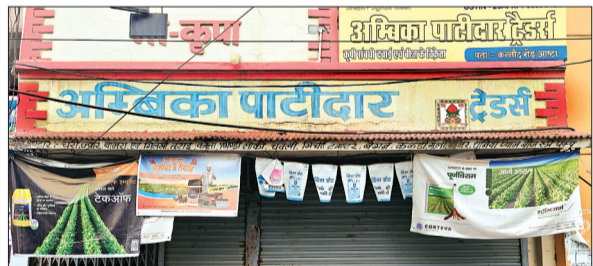
सीहोर। फफूदी नाशक दवा से किसानों की सोयाबीन फसल खराब होने पर सहायक संचालक ने आष्टा की अबिका पाटिदार ट्रेडर्स को किया सील।