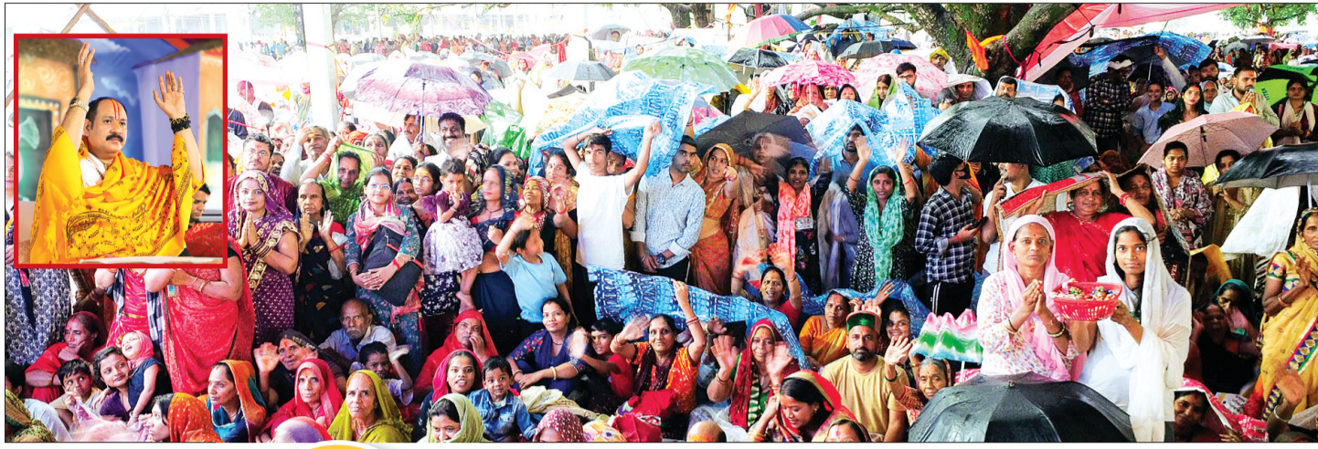
हरिभूमि न्यूज ▶▶ सीहोर

कुबेरेश्वर धाम पर शनिवार से शुरू हुए पांच दिवसीय गुरुपूर्णिमा महोत्सव के दौरान शिव महापुराण कथा सुनने के लिए बड़ी संख्या में श्रद्धालु पहुंचे। आलम यह था की पांडाल छोटे पड़ गए। श्रद्धालुओं की आस्था को तेज बारिश भी कम नहीं कर सकी। इस दौरान श्रद्धालुओं ने बारिश से बचने के लिए छाता, पन्नी, तिरपाल का सहारा लेकर कथा का श्रवण किया।