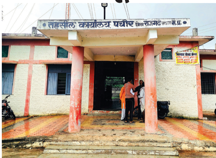
ग्रामीणों को होती है सबसे ज्यादा परेशानी

तहसील मुख्यालय पर भूमि और मकान की खरीदी-बिक्री को लेकर रजिस्ट्री करने की सुविधा नहीं है। जिससे लोगों के धन और समय की बर्बादी होती है। पचोर तहसील में 33 पटवारी हल्के और 56 गांव आते हैं, सरकार ने 2008 में पचोर को तहसील दर्जा दिया था। उप पंजीयक दफ्तर नहीं होने से क्षेत्र के लोगों को रजिस्ट्री के लिए सारंगपुर, ब्यावरा राजगढ़ जाने पर मजबूर हैं। रजिस्ट्री की सुविधा मिलने से शासन की राजस्व आय में भी बढ़ोतरी होना तय है। उप पंजीयक दफ्तर शुरू कराने की मांग क्षेत्र के लोग कई सालों से कर रहे हैं। परंतु शासन स्तर से रजिस्ट्री की सुविधा मुहैया नहीं कराई जा रही है। ऐसे में क्षेत्र के व्यापारी, किसान सहित हर वर्ग के लोगों को अपनी प्रॉपर्टी की रजिस्ट्री के लिए जाना पड़ता है।