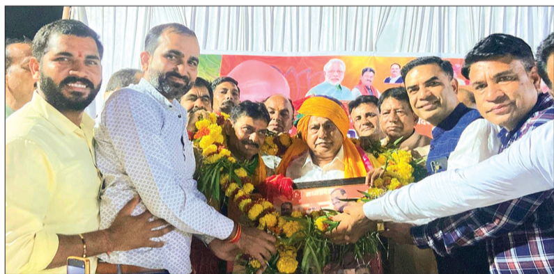
हरिभूमि न्यूज ▶▶ जावर